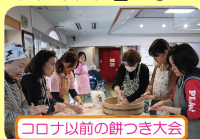
コロナ以前の餅つき大会

ボランティアの方々に一階の喫茶スペースの一角に、三月はお雛様・五月には兜の置物等、季節に合わせた装飾を手作業で組み立て飾って頂いています。