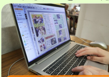
あさひ園だより作成中

「あさひ園だより」は、メンバーが担当ページを決め、パソコンのソフトウェアを使い、試行錯誤を重ねながら、全て広報委員が手作りで広報誌を作成しています。