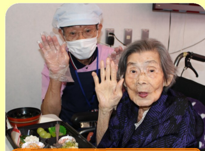
美味しかったです