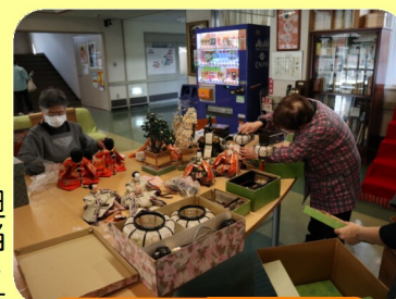
ひな壇の飾りつけ

【岡山南高校との取り組み】 昨年はデニム生地のマスクをプレゼントして下さいましたが、今年はマスクケース入れを作成中。生徒さんが来られない為、先生と入念に打ち合わせをしています！