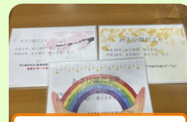
だよりのファイリング

あさひ園の四季の写真を廊下に飾り、実習生や見学者などにあさひ園の取り組み等の説明を行なう際に使っています。