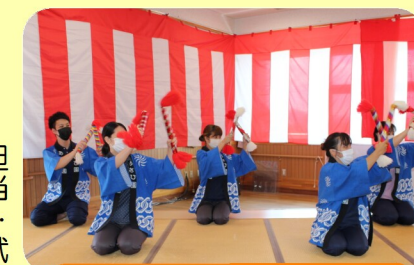
職員による銭太鼓