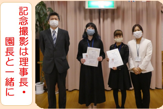
記念撮影は理事長・園長と一緒に