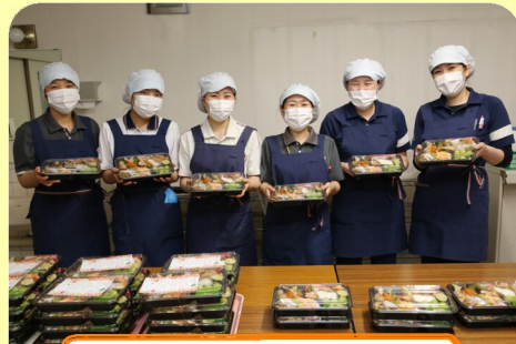
私たちが作りました