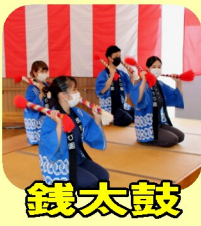
銭太鼓 まだまだ長生きするよ～