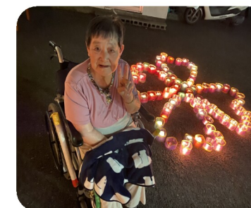
キャンドルリレー