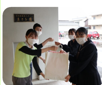
岡山南高校の皆様