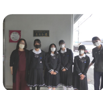
岡輝中学校の皆様

ボランティアに来て下さる皆様のおかげで、あさひ園での生活がより豊かに快適になっています。いつもありがとうございます！！