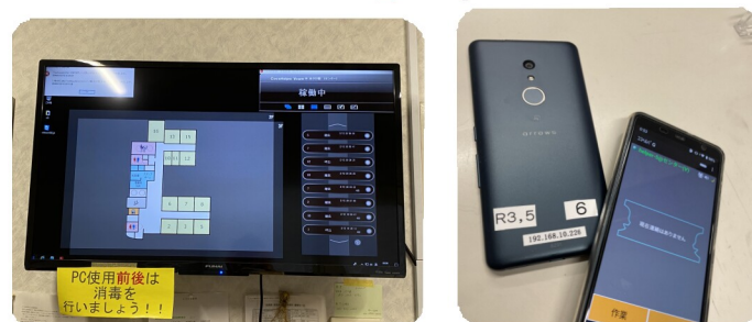
ナースコール盤と子機

ICT (情報通信技術) を活用しながら、ご利用者と向き合える介護をこれからも行なっていきます。