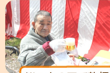
桜の木の下で乾杯