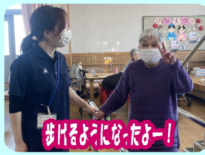
歩けるようになったー！