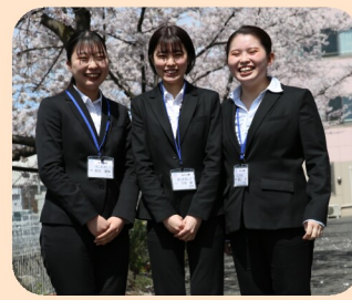
笑顔が素敵な三人