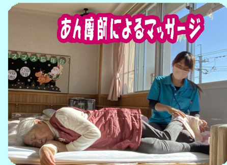
あん摩師によるマッサージ