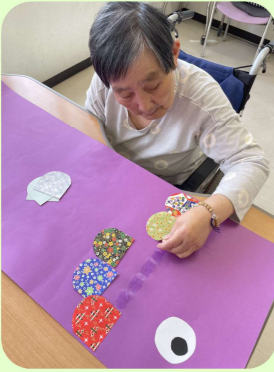
手作り鯉のぼり作成