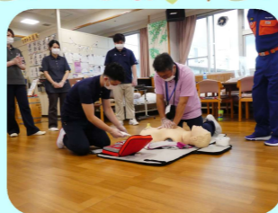
施設内研修の様子

② 医療的ケア研修 初任者研修等の各種研修 資格取得に対するの応援手当もあります。また、喀痰吸引の研修は施設内での実習が可能です、多くの職員が取得しています。