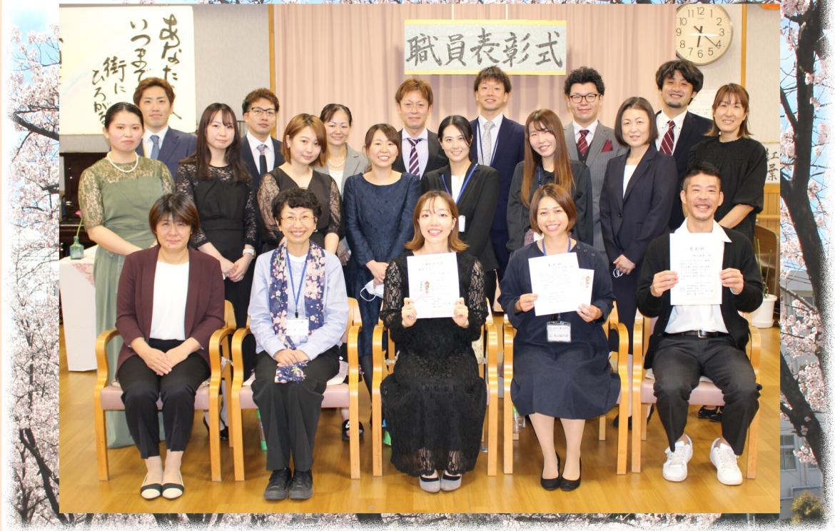
※当日勤務して頂いた職員のおかげで無事開催することが出来ました。ありがとうございました。 写真撮影の時のみマスクを外しています。