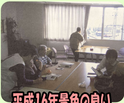
平成16年景色の良い3階食堂が完成!