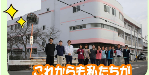
これからも私たちがあさひ園を創っていきます