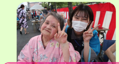
今年は天気にも恵まれたよ♪