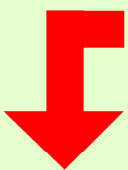
R4年12月完成しました