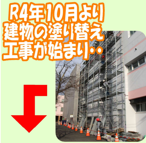
R4年10月より建物の塗り替え工事が始まり...

多くの皆さまのご協力・ご支援のもと、あさひ園だよりも記念すべき一五〇号を迎えることができました。これまでにあさひ園に関わって下さったご利用者やそのご家族、あさひ園を創り上げてくれた先輩方のお陰で現在も笑顔溢れるあさひ園があるように思います。一面では皆さまに感謝の気持ちを込めて、これまでのあさひ園の歴史についてはありますが、ご紹介していきたいと思っております。