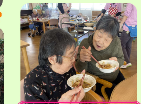
あったかくておいしいな~