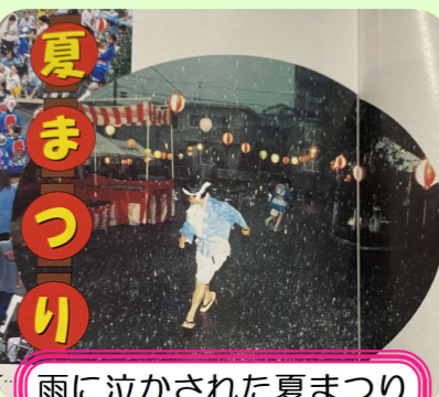
夏まつり 雨に泣かされた夏まつり