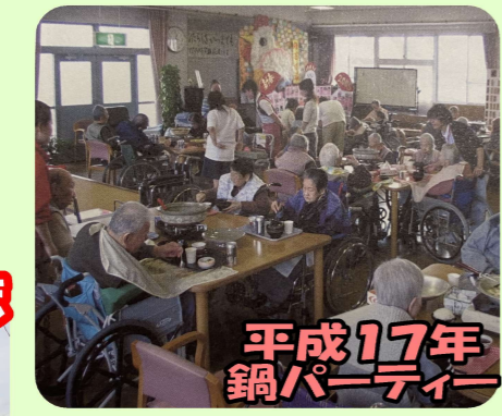
平成17年鍋パーティー