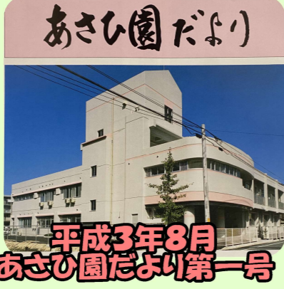
平成3年8月あさひ園だより第一号