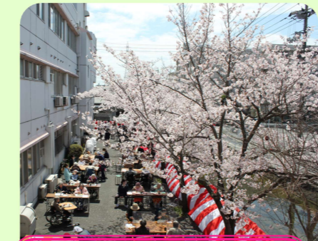
桜も大きくなっています