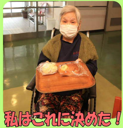
私はこれに決めた!