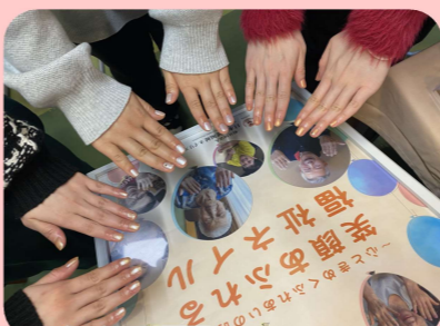
「綺麗になりました!」