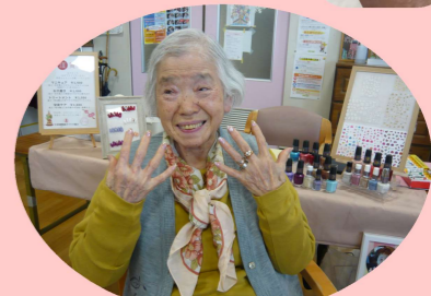
★お互いに見せあい★