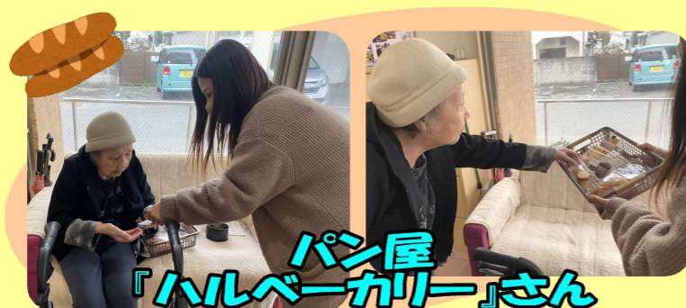
パン屋 『ハルペーカー』さん