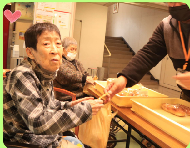
おいしいパンが 食べれて嬉しいわ~★

十二月より、パンの移動販売に月三回来ていただいています。美味しいパンを食べられる事はもちろん、種類が豊富な中から、ご自身で好きなパンを選ぶことの楽しさもあります。外へ買い物に出ることが難しくても、実際に来て頂けることで活気溢れるひとときとなっています。