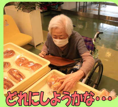
どれにしようかな...