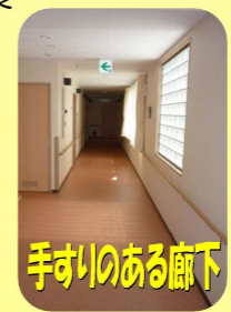
手すりのある廊下