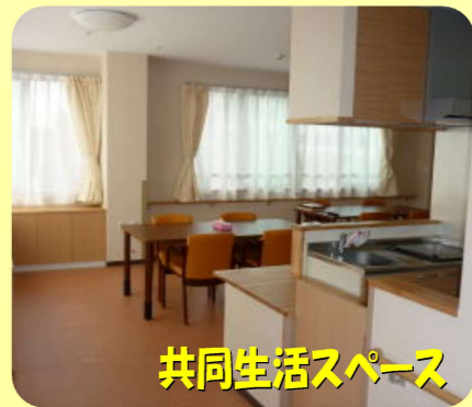
共同生活スペース