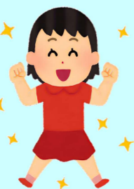
ダーウィンハコベルデ！！