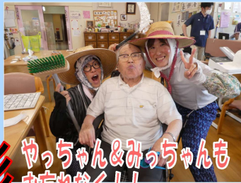
やっちゃん&みっちゃんも お忘れなく！！