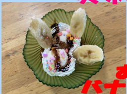
おやつは バナナパフェ♪