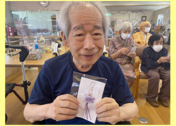
職員より亀の お守りをプレゼント