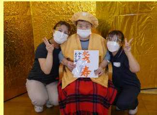
皆様の健康を 祈って・・・