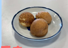
冷カステラも 召し上がれ～