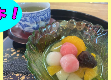
おやつは 紅白あんみつ♪