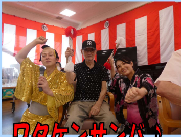
ワタケンサンバ！ 記念撮影