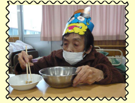
鬼札倒し&豆つかみゲーム