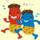
節分レクリエーション